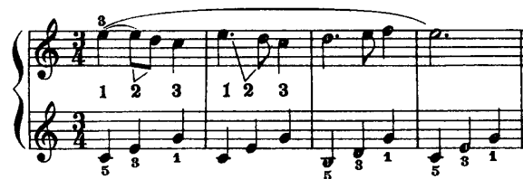
譜例3 (バイエル第48番より)

彼らも、音符によって持続時間が違うらしいことには気づいているのだが、どのような決まりによってそれが定められているかが分からずに、「何となく」でごまかしているのである。音楽的時間を区切るための単位を感じていないのだから、その長さの決まりが分からないのは当然である。